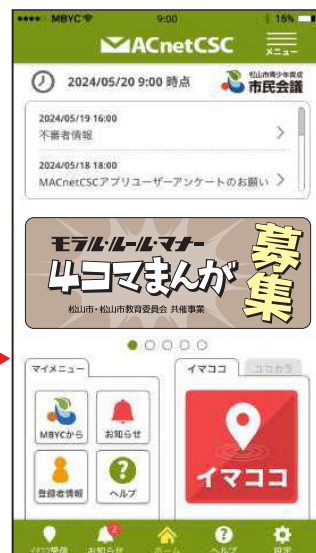
新アプリホーム画面→